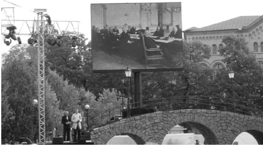
Iscenesetjing gjennom bruk av tid og stad. Feiring av Karlstadkonvensjonen 23. september 2005 på torget i Karlstad, like ved Frimurarlosjen, der forhandlingane gjekk føre seg i 1905.

Moss planlegg eit «fylkesspill» som synleggjer «Østfolds betydning» gjennom hendingane på Spydeberg prestegård og i Konventionsgården i Moss.