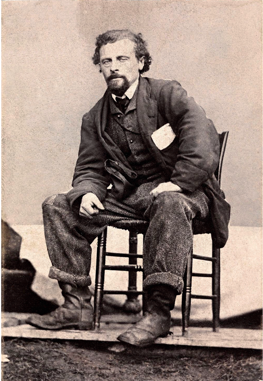
Portrett av Marcus Thrane.