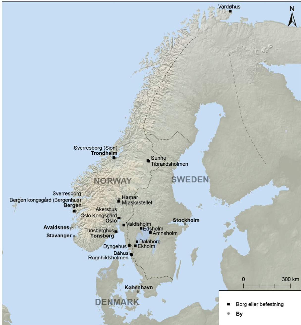
Figur 6. Kjente kongelige borger og befestninger i middelalderens Norge og i norskkontrollerte Vest-Sverige i andre halvdel av 1300-tallet. Illustrasjon: Ingvild Tinglum Bøckman, MCH.