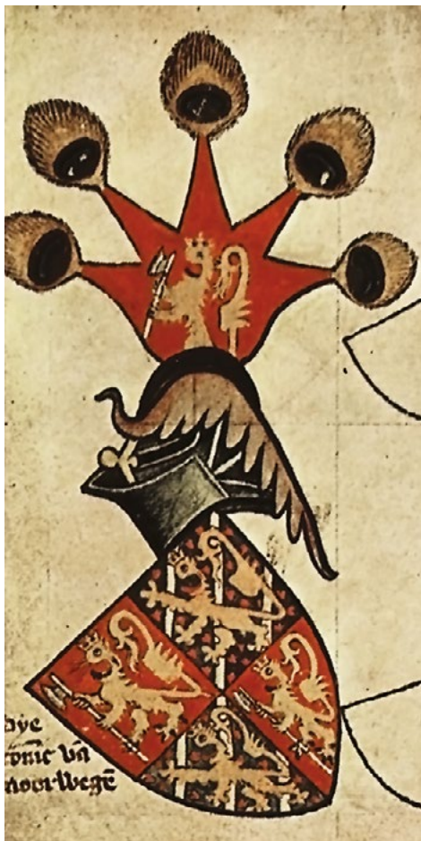
Figur 5. Kong Håkon 6. Magnussons (1355–80) norsk-svenske våpenskjold i våpenboka fra Gelre (Geldern) fra andre halvdel av 1300-tallet. Håkon 6. ble valgt til konge av Sverige i 1362, men avsatt to år seinere. Kongen fortsatte imidlertid å titulere seg konge av Norge og Sverige og kontrollere deler av Vest-Sverige. Wapenboek Gelre, folio 66v.