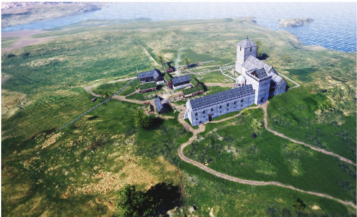
Figur 2. Øverst: Avaldsnes i dag med Olavskirken. Nederst: Rekonstruksjon av hvordan det kongelige anlegget på Avaldsnes kan ha sett ut rundt år 1300. Rekonstruksjon: R. Børsheim/Arkikon.