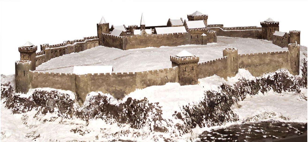
Figur 3. Modell av den kongelige borgen Tunsberghus ved Tønsberg på 1300-tallet. Borgen var en av de fremste kongelige residensene på 12- og 1300-tallet.

for å vise seg for befolkningen, å kontrollere kongelige ombudsmenn og ikke minst å fortære mye av kongens inntekter, som kom inn som naturalia.