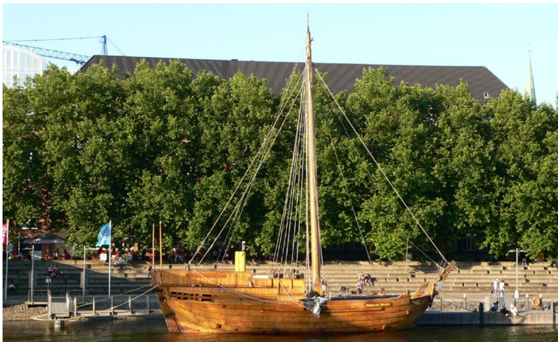
Figur 7. Rekonstruksjon av en Bremen Hansekogge ved det tidligere Koggemuseet i Malmö. Foto: Eva Kröcher. Lisens: CC BY-SA 2.5 Deed.

Kong Magnus utnevnte en riksforsander, en drottsete, for Norge, ridderen Orm Øysteinsson fra Båhuslen, som skulle fungere fram til Håkon ble myndig. På vegen sørover fra Bergen stoppet kong Magnus på Avaldsnes, og både hustrua, dronning Blanche, sønnene og ei rekke av stormennene må ha fulgt med kongen til Avaldsnes og videre (Moseng mfl. 2007: 173–176, 328–333).