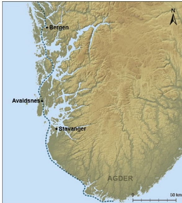
Figur 4. Skipsleia langs Sørvest-Norge. Illustrasjon: Ingvild Tinglum Bockman, MCH.

Mariakirken skulle være kongens kansler, forutsatte at seglet skulle følge kongen, ikke kansleren , dersom sistnevnte som prost måtte forbli i Oslo når kongen reiste rundt i landet. Seglet ble altså ikke stedbundet til Oslo, men forble knyttet til den mobile kongen. Kanslerutnevnelser og byggingen, men trolig ikke fullføringen av Akershus og utpekingen av Mariakirken som kongelig gravkirke bidrog likevel utvilsomt til å heve og styrke Oslo som kongelig residens- og forvaltningsby. Å karakterisere byen i denne perioden som Norges «hovedstad» i noen meningsfull betydning av ordet savner imidlertid historisk grunnlag (Opsahl 2015). Kanslerordningen ble ikke systematisk fulgt etter Håkon 5.s død i 1319, og den norske kansleren fikk redusert betydning i det nordiske unionsmonarkiet fra slutten av 1300-tallet (Kalmarunionen). Det samme gjaldt Mariakirkens posisjon som kongelig gravkirke, som