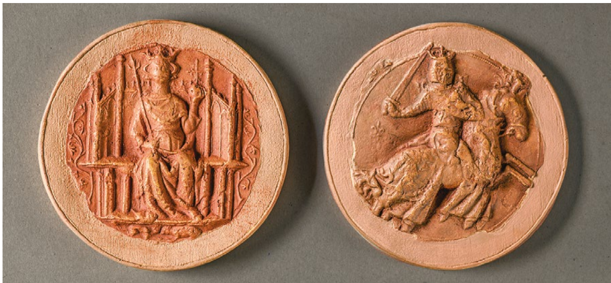
Figur 1. Håkon 5. Magnussons (1299–1319) majestetssegl, forside og bakside.

Norges lange unionstid der monarkene stort sett var fraværende i Norge.