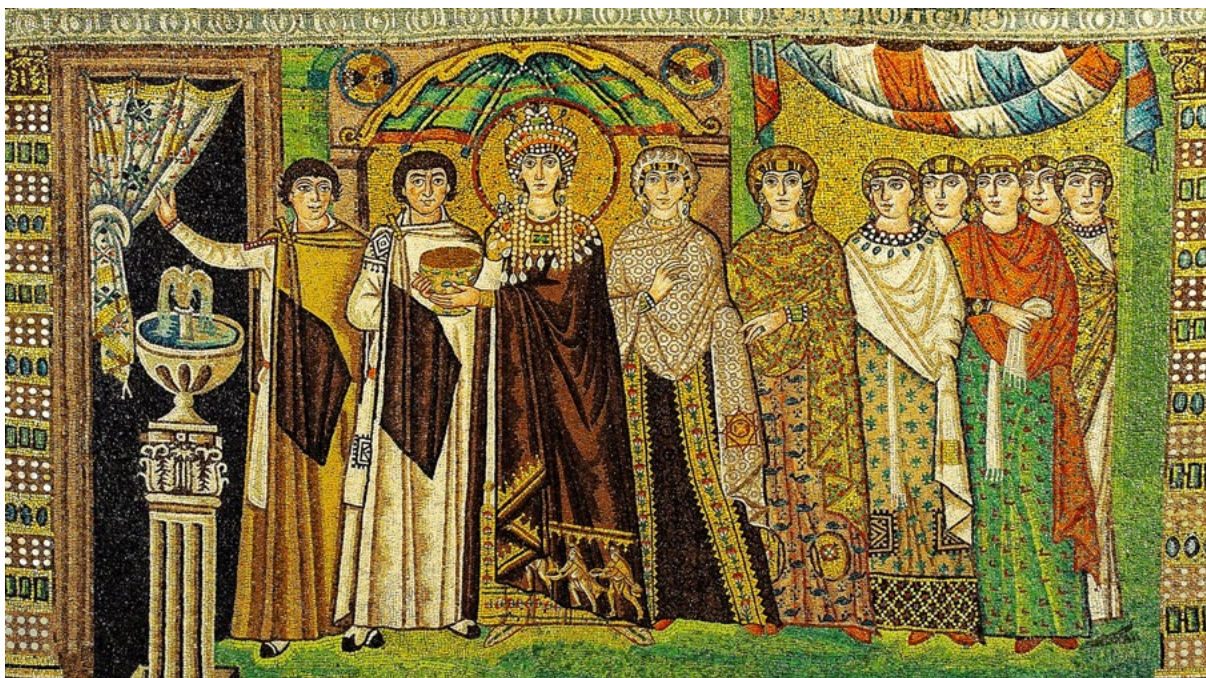
Figur 4. Theodora i Ravenna, kejsar Justinianus gemål, avbildad i basilikan San Vitale uppförd i Ravenna, Italien år 547 e.Kr. Kejsarparet var barnlöst. Theodora gjordes till medregent och stärkte kvinnans rätt på olika juridiska områden (Evans, 1998).

guldtrådar. Kring huvudet hade hon en mönstrad schal av siden och om livet bar hon ett bälte fäst med ett tungt guldbelagt silverspänne. Hennes smycken var i övrigt av guld: ring, örhängen, stor nål och spänne med halvädalstenar. Kring benen hade hon benlindor med silverspännen och nedanför fanns de purpurfärgade spetsiga läderskorna. Föremålen var välanvända och dessutom ”lite före sin tid”, alltså innovativa smycken och dräkt detaljer av typer som först efter ett tag nådde ut till det stora flertalet (Périn et al., 2013, s. 112–116).