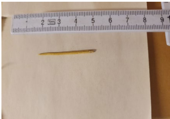
Figur 5a. Guldnålen liknande den i Flaghaugens kista från grav 38, Räcksta-Beckomberga i Spånga socken, Uppland. Stockholms stadsmuseum SSM 20129.