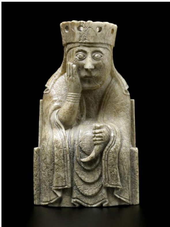
Figur 1. Drottningen sittande på sin tron. Hon avbildas som en tänkare i rik dräkt med dryckeshorn i handen och krona på huvudet. Detta är en av tre schackpjäser som avbildar drottningar som hittades på ön Lewis, Skottland, men som tros vara tillverkade på slutet av 1100-talet i Nidaros, Trondheim.

kunglig värdighet, hantering av vasaller och utländska diplomatiska beskickningar (Downham, 2019, s. 153).