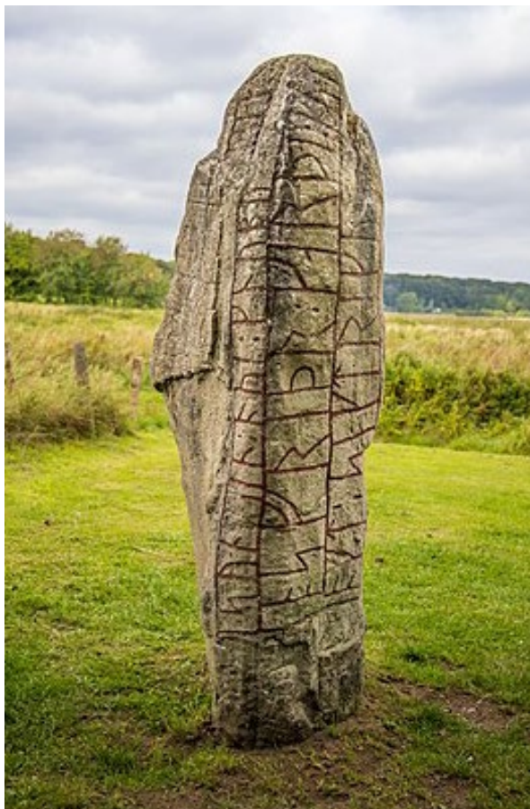
Figur 2. Runstenen över sonen Sigtrygg rest av hans mor Asfrid innehåller dessutom bara uppgifter om fadern Gnupas namn. Denna resliga runsten, en kopia av Hedeby 2, är ristad med kortkvistrunor (svensk-norska runor) och står rest vid en korsväg i landskapet.