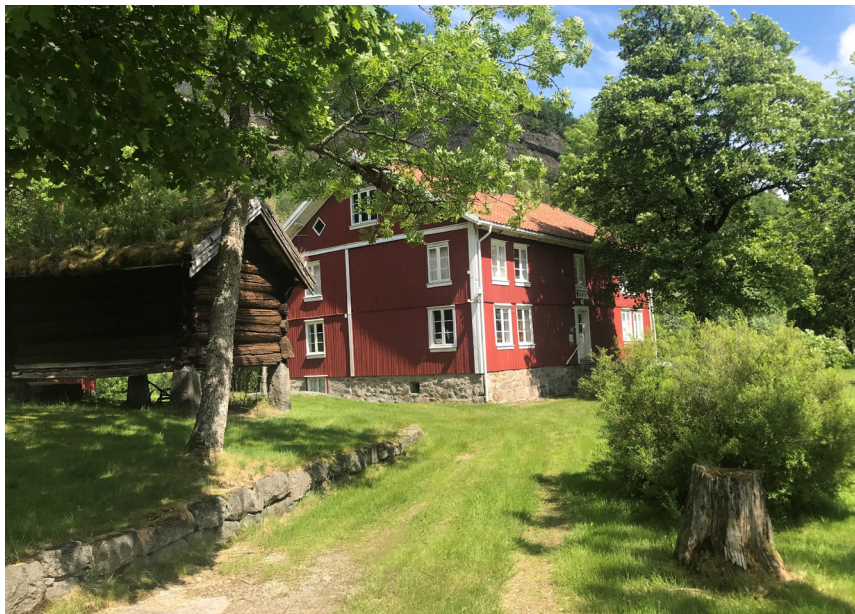
Lensmannsgarden på Fennefoss. Her skal Hans Nielsen Hauge ha budd da han besøkte bygda hausten 1803. Bygningen er no ein del av Setesdalsmuseet.

Men eit snautt tiår var altså møllebruket på Fennefoss fundament for ein aktiv haugianarflokk. I utgangspunktet var dei nokre håpefulle idealistar med ein dristig ide. På det praktiske og tekniske området var det ei utfordring å reise kapital til anlegget, få tak i fagfolk og skaffe maskineri. Som på andre bedrifter Hauge var med på å opprette, hadde også flokken på Fennefoss ein dobbel agenda: Dei skulle drive næringsretta arbeid etter kristeleg ideal, og dei skulle bære Hauge-vekkinga vidare ut til bygdefolket. Med dette utvikla dei ein særeigen arbeidskultur. Det dreier seg ikkje berre om fordeling av oppgåver og organisering av arbeidsstyrken. Vi må også spørje korleis dei levde saman, korleis de innretta dagane sine og korleis dei blei møtt i lokalsamfunnet. Så langt kjeldematerialet opnar for innsyn, er det slike tema vi skal sjå nærare på i dette kapittelet.