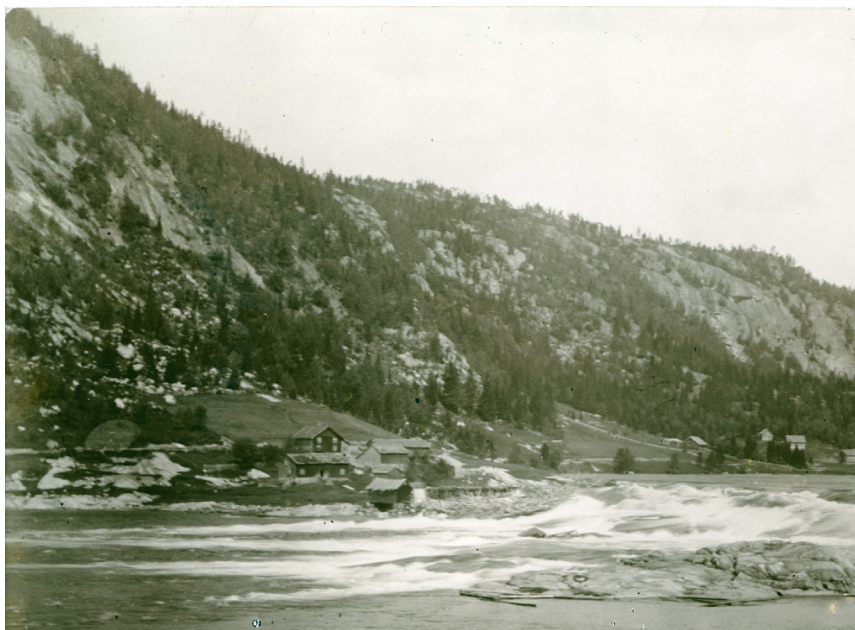
Odden ved Fennefoss der papirmølla sto, tidleg på 1900-talet. Den lange bygningen til venstre i bildet blei bygd som bustad for arbeidarane ved mølla. Foto: A. Abrahamson/Agderfoto. Gjengitt med tillatelse. Alle rettigheter er forbeholdt. Kan ikke gjenbrukes uten tillatelse.

gi innblikk i meir allmenne tilhøve rundt arbeidarane ved møllebruket. Men før vi går tettare inn på den lokale problematikken, treng vi eit overblikk over Hauge-rørsla som uttrykk for sosial og religiøs mobilisering i det tidleg-moderne Norge.