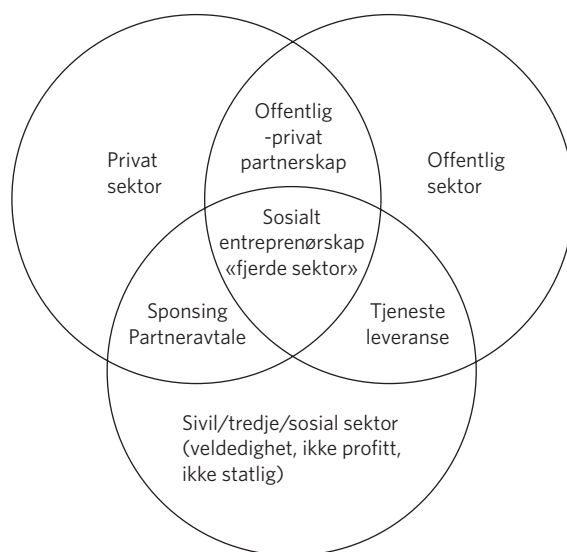
Figur 3.2 Fjerdesektormodellen (gjengitt med tillatelse fra Brøgger, 2017, s. 15, etter Ellis, 2010, s. 120)

medvirkning fra de menneskene som skal ta i bruk løsningen. Det er en kompleks prosess som innebærer samskaping, samarbeidsmetoder og involvering av alle parter. Det finnes et utall av forskjellige kreative verktøy for ideskaping og kreativ tenkning (se Turunen, 2013; se også kapittel 6).