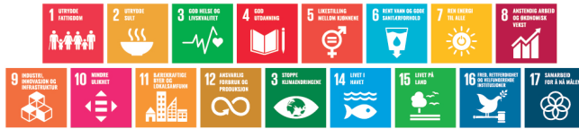
FNs mål for bærekraftig utvikling