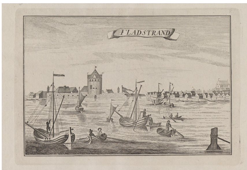
Prospekt af Fladstrand i Pontoppidans Danske Atlas (1769). Til venstre ses befæstningen, som byen til højre voksede op omkring i slutningen af 1600-tallet.

Ifølge en præsteindberetning var der i 1568 26 huse ved stranden i Flade sogn. Udover fiskeri levede indbyggerne af smugleri. Handelen i Fladstrand synes at være taget til efter 1660, da tabet af Bohuslen gjorde, at al skibsfart mellem Danmark og Norge fremover kom til at gå via Nordjylland. Tilsandingen af Sæbys havn gjorde desuden, at handelen flyttede til Fladstrand, hvor adgangsforholdene var bedre, hvorfor byen blev pålagt at betale konsumtion i 1672. På få år blev fiskerlejet forvandlet til en by med 565 indbyggere i 1696. 26