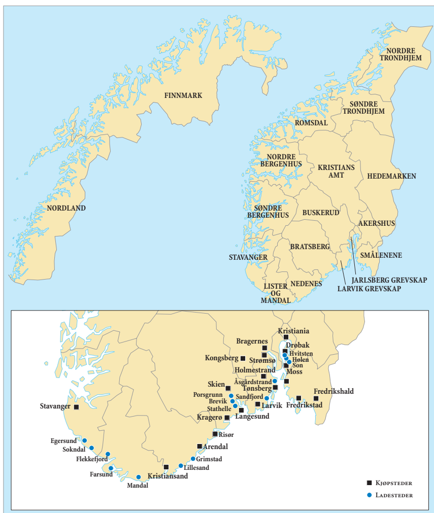
Kart over sønorske byer ca. 1800.