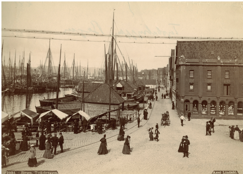
Kjøpmannsgårdene som lå på rekke og rad langs havna, la til rette for kontakt både med andre kjøpmannsgårder i byen og med handelsforbindelser i omlandet og internasjonalt. Her vises Bryggen i Bergen på 1800-tallet, men tilsvarende byggemåte var typisk for handelsbyer både i andre norske byer og internasjonalt.

nettopp kjøpmennene hadde avgjørende innflytelse. Slutten av 1700-tallet viser imidlertid også at den tid da dette framsto som en opplagt løsning, nærmet seg slutten. Småborgerskapet krevde medbestemmelse, og kongen ga dem et betinget medhold i det. Da Grunnloven ble vedtatt i 1814, var oppfatningen at også småborgerskapet skulle med – alle menn med borgerskap i byene fikk stemmerett til Stortinget. Det drøydde imidlertid til 1837 før den samme stemmeretten ble grunnlaget for styret i byene.