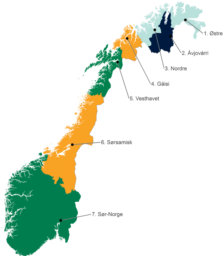
Figur 1.1 Valgkretsene ved sametingsvalg