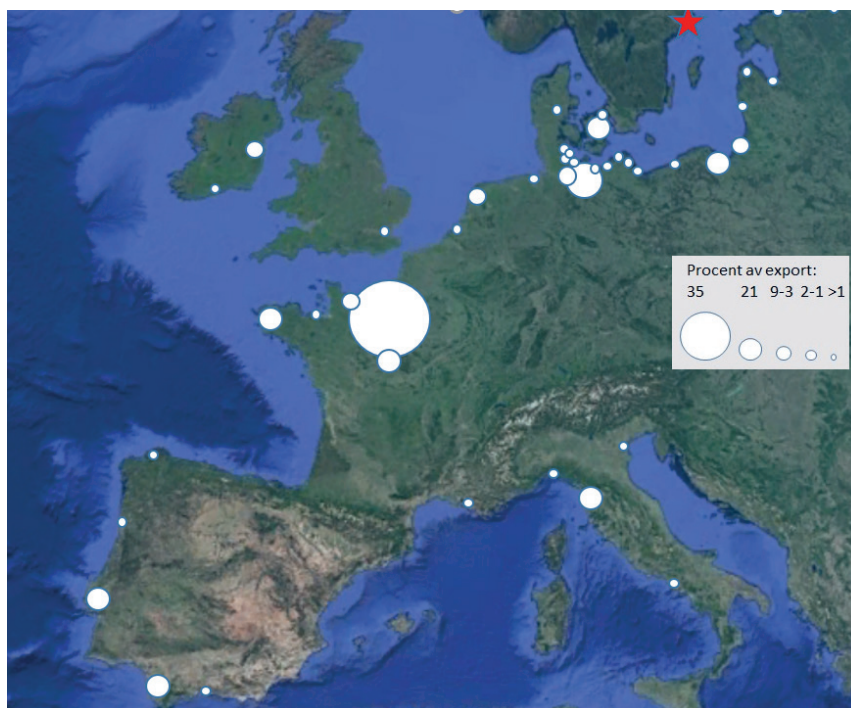
Figur 3 De europeiska destinationer som mottog koppar och mässing från Sverige perioden 1760-1770 och 1779-1799 (procent)

Källa: RA, Bergskollegium HK, D 5:22 för perioden 1760-1770 och dels ACD, Familjegraven F1:2 för perioden 1779-1799.