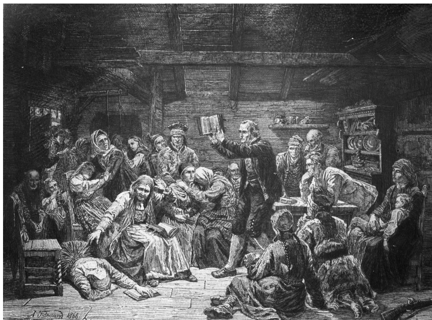
Fanatikerne, 1865, Adolph Tiedemann.

Det er to viktige trekk ved det nordnorske religiøse oppbrotet på 1800-talet: dei relativt mange dissentarane og den læstadianske rørsla. Av dissentarane var det folk frå det breie lag, og kanskje helst frå den betrestilte delen, som tok skrittet ut av kyrkja. Tilhengarane av Lars Levi Læstadius (1800–1861) kom helst frå fattigare kår og profilerte seg i pietistisk opposisjon, men – til liks med den lågkyrkjelege rørsla sørpå – braut ikkje rørsla med kyrkja.