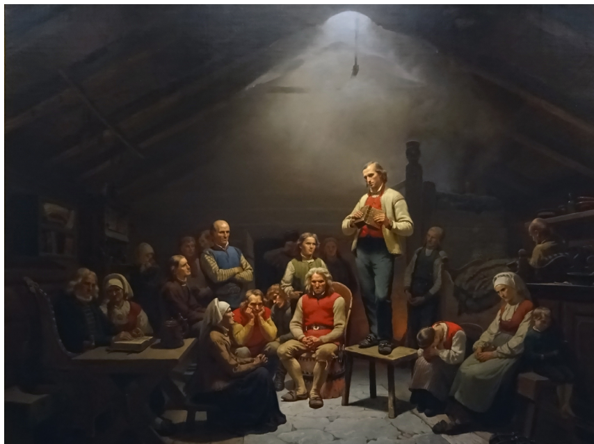
Haugianerne, 1848, Adolph Tiedemann.